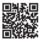
Szene aus dem Film „Berufswunsch Landärztin - Antonias Weg“ (verfügbar auf YouTube: https://youtu.be/HdeQCagRGrM ).