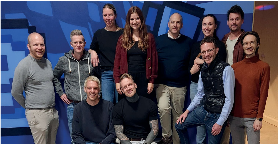
Kongressteilnehmende des Instituts für Allgemeinmedizin nach einem Event im Rahmen des DEGAM-Kongresses 2025 in Hannover (Kongressbericht auf Seite 2)

Liebe Kolleginnen und Kollegen, liebe Leserinnen und Leser,